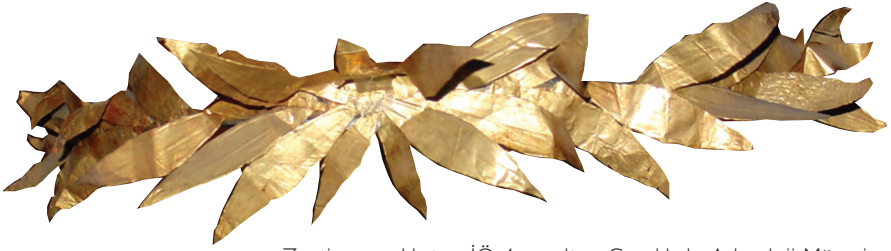
Zeytin yapraklı taç, İÖ 4 yy, altın, Çanakkale Arkeoloji Müzesi.

bahçesine dikilmiş ve bu ağaçlardan Athena'nın kutsal zeytin ağaçları yetiştirilmiştir. Herodotus'un söylediğine göre moriae diye bilinen, Athena'nın kutsal zeytin ağaçları özel yasalarla korunurdu. Öyle ki bu ağaçların tek bir dalını izinsiz koparmak bile ölümlü cezalandırılan bir suç olarak kabul edilirdi. Çünkü Athena'nın zeytin ağaçlarının dallarından örülen taçlar her dört senede bir, Tanrıça Athena'nın doğum günlerinde yapılan Panathinakos oyunlarında kazananların başına ödül olarak takılırdı. Oyunlarda kazanan atletlere ödül olarak verilen amforalar Tanrıça Athena'nın ağaçlarından toplanan zeytinlerden sıkılan zeytinyağıyla doldurulurdu.