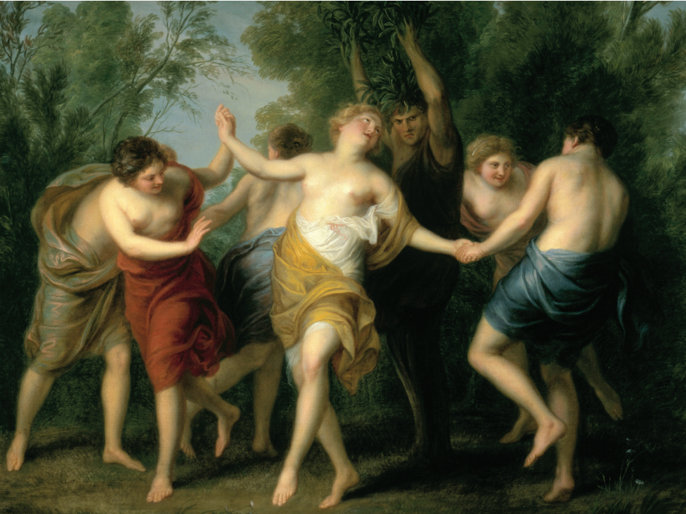
"Musalarla Dans" (yabancı zeytin ağacının ortaya çıkışı), A.C. Lens, 1780, yağlı boya, Kunsthistorisches Museum, Viyana.

Bazı inanışlara göre Herakles yabancı zeytin ağacını uzak ülkelerden, Hyperbore diyarından getirmiştir. Hyperbore, Boreas'ın, yani kuzey rüzgârının ötesindeki ülkedir. İlkçağın ütopyası olan bu ülkede saf ve iyiliksever insanlar yaşamış ve bu insanlar çok uzun ömürlü olurlarmış. Herakles'in yanından ayırmadığı topuzunun parlak ve dayanık-