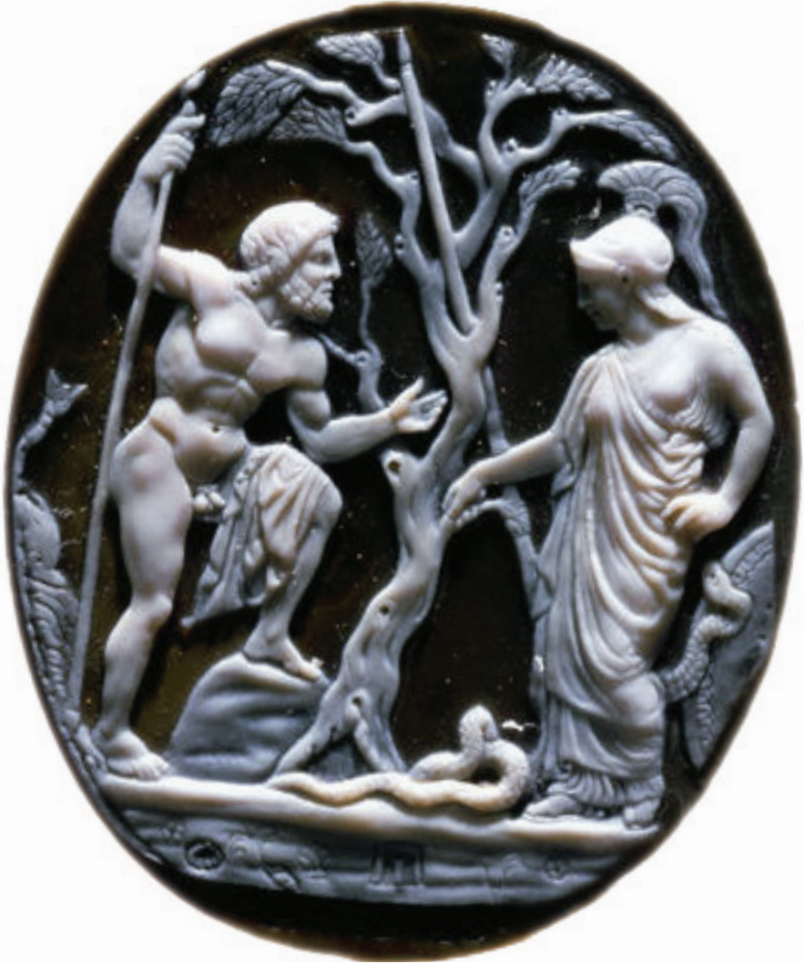
"Athena ve Poseidon", oniks kabartma, Napoli Arkeoloji Müzesi.