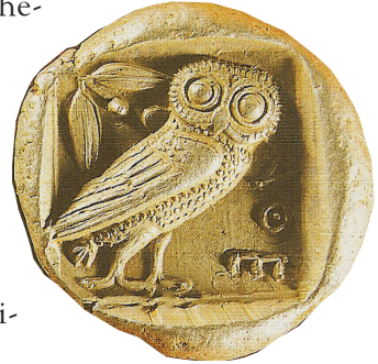
Gümüş Atina sikkesi, İÖ 5. yy, Anadolu Medeniyetleri Müzesi.

Olimpiyat oyunlarında kazananların başına yabancı zeytin dallarından taç takma geleneğiyle bir başka Tanrı'yla ilgilidir. Panathinakos oyunları nasıl Bilgelik Tanrıçası Athena ile ilgiliyse, Olimpiyat oyunlarının da insanlığa Herakles'in bir armağanı olduğuna inanılır. Herakles'in Zeus tapınağının yanına diktiği ya