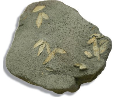
Zeytin yaprağı fosili, Santorini Arkeoloji Müzesi.

Z eytin yaprağı fosilleri ve çekirdek kalıntıları üzerine yapılan incelemeler bizi yaklaşık 50 000 yıl geriye götürüyor. Zeytinin insan eliyle islah edilmesinden binlerce yıl önce de Orta Afrika'dan Kafkaslar'a kadar geniş bir coğrafyada zeytinle aynı familyadan birçok ağaç doğal ortamında bulunuyordu. Çeşitli kaynaklara göre bugün bildiğimiz zeytinin atası olarak kabul edilen yabani zeytin ağacı Olea europea oleaster ilk önce Anadolu'da ortaya çıktı. Bugün Anadolu'da hâlâ gözlenebilen uçsuz bucaksız delice ormanlarının varlıklarını binlerce yıldır sürdürdükleri düşünülüyor.