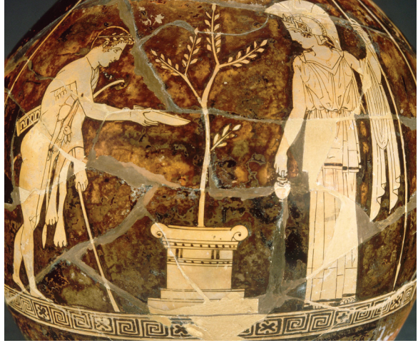
"Athena ve Herakles", Niobides Ressamları, İÖ 5. yy, kırmızı figürlü oinokhoe, Louvre Müzesi.

lı zeytin ağacından olduğu bilinmektedir. Zeytin ağacının Herakles'in topuzunun yere değmesiyle ortaya çıktığına dayanan efsaneler de vardır. Herakles, zeytin ağacını insanlara ilk defa hediye eden Tanrı olmasa da zeytinin geniş bir coğrafyada yaygınlaşmasında katkısı olduğuna inanılır.