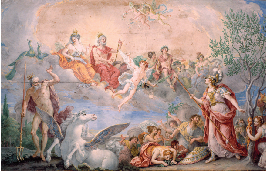
"Athena ve Poseidon arasındaki yarış", G. Battisto Mengardi, 1780, yağlı boya, Privli / Monfrin Sarayı, Venedik.

zı antik kaynaklara göreyse tuzlu su dolu bir kuyu ortaya çıkmış Poseidon'un insanlığa hediyesi olarak. Ardından Zeus'un öz kızı, Bilgelik Tanrıçası Athena mızrağını toprağa batırınca bir zeytin ağacı yeşermiş. Gümüşü yaprakları güneşte ışıldayan zeytin ağacını gören Zeus yeni kentin sahipliğini tereddütsüz Athena'ya bırakmış.