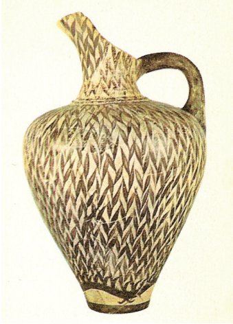
Zeytin yapraklı sürahi, İÖ 1700-1600, pişmiş toprak, Heraklion Arkeoloji Müzesi, Girit.

de ağrı duydu, çok incindi ve ağrıdan Tanrı'ya yakındı. Bunun üzerine Cebrail zeytin ağacı indirdi ve buyurdu: 'Bunun yemişini ye ve sık ki bunun içinde bütün ağrılara şifa vardır'..."