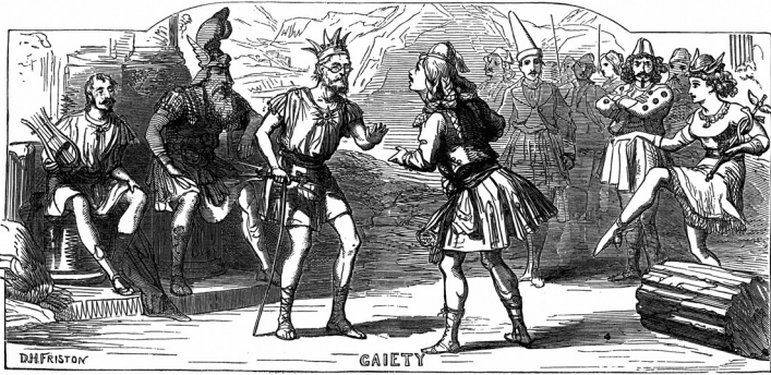
İkariyalı Thespis çizimi, Londra, 1872.

İşte o anlarda kendisi ne kadar farkında olmasa da Batı dünyasındaki modern dramayı kurmaktadır.