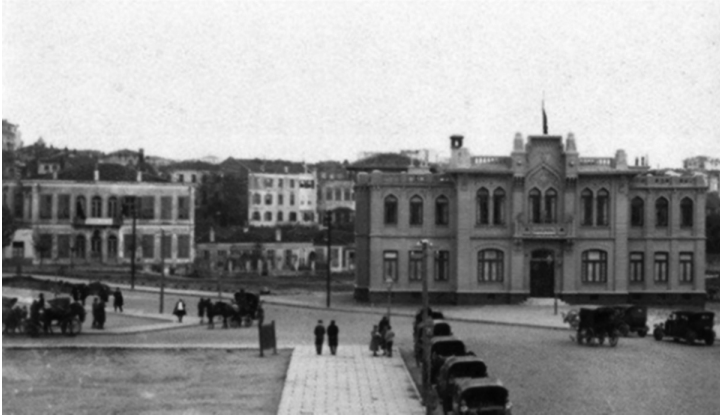
Kadıköy Şehremaneti binası.

muhalefet gücü çıkmış, halk arasında umulmadık derecede taraftar bulmuştu. Kadıköy Şehremaneti binasında ilk belediye seçimleri yapılacak, seçimlere Serbest Fırka'nın adayları da katılacaktı. Seçim günü İçerenköy, Bostancı ve civarından at, öküz arabalarına dolan seçmenler, “Yaşasın Serbest Fırka! Yaşasın Fethi Bey!” diye bağırarak büyük bir kalabalık halinde Bağdat Caddesi'nden geçip Kadıköy'e gelmişler. Şehremaneti binasının önündeki kumlukta iki partinin yandaşları birbirine girmiş, kafalar yarılmış, kollar kırılmış. Aynı olaylar İzmir'de de baş gösterince 17 Kasım 1930 günü