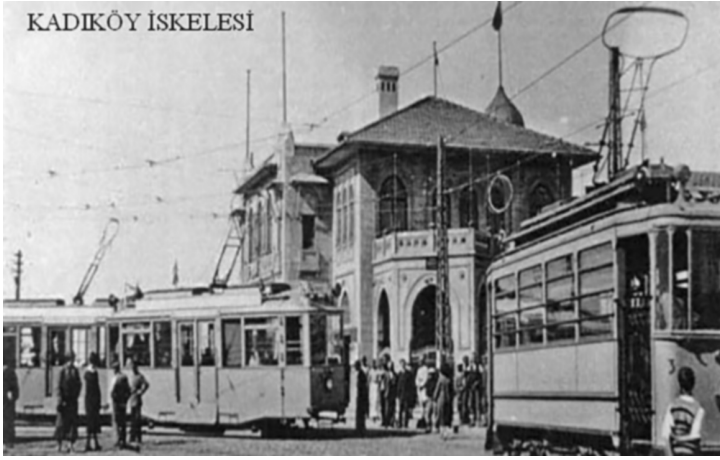
Eski iskele ve tramvaylar.

seyredebilirsiniz. Kadıköy hem mütevazı halk tabakasının hem de sosyete mensuplarının yatağıdır.