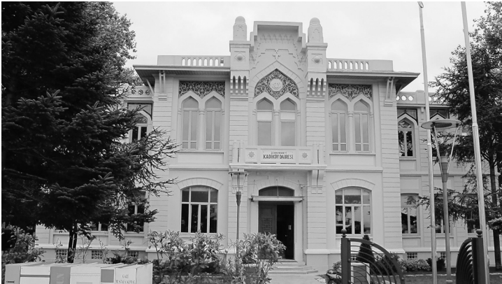
Kadıköy belediye binası.

Uzmanlara göre uzun bir süre küçük bir nahiye olarak kalan Kadıköy'ün gelişmesi, buraya vapurların işlemesiyle hızlanmıştır. 1869 yılında İstanbul Belediye Nizamnamesi yapılırken kent on dört daireye (yönetsel bölgeye) taksim edilmiş, Kadıköy de on üçüncü daire olarak şehremaneti (belediye) statüsüyle Üsküdar Sancağı'na bağlanmıştır. O zamana kadar Kadıköy'de sürekli belediye memurları ve temizlik işçileri bulunmuyor, arkalarında küfelerle dolaşan “özel” çöpçüler evlerden topladıkları çöpleri ücret karşılığında götürüp denize döküyorlardı. Şehremaneti kurulunca Kadıköy de at ya da eşekle çekilen çöp arabalarına kavuşmuş, toplanan çöpler uzun zaman önce Fikirtepe'de açılmış büyük taşocaklarına boşaltılmaya başlanınca, deniz de atık yeri olmaktan kurtulmuştu.