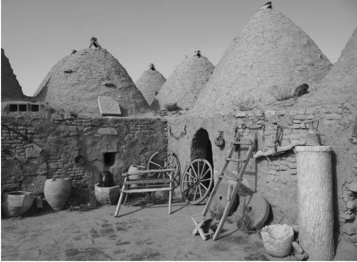
Harran'ın günümüzde de yaşamakta olan konik tavanlı evleri. Bu anı kovanı biçiminde inşa edilen evlere Mezopotamya'da rastlanıyordu.

Sabii dininin ortaya çıkarken hangi zaman dilimlerinde diğer dinler ve inanışlardan etkilenererek son biçimini aldığı, Hermetizmle ilgili bölümde Gnostisizmin ne olduğu, ateş kültürünün önemi, bu kültü halen yaşatmakta olan Asurların torunları olan Mihallemliler ve ateşgahlar, güneş tapınakları üzerine kurulmuş olan kadim Süryani kiliselerinden de bahsedilecektir. Son olarak da ibadet biçimleri, dinî gelenek, görenek ve ayinleri, günümüz dinlerine olan benzerlikleri görülecektir.