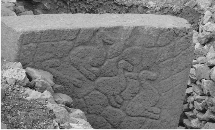
Göbeklitepe kazısı; İÖ 10.000 yıllarına tarihlenen bu kadar eski bir kült yeri civardaki diğer kültürleri de etkilemiş olmalıdır.

Harran Sabiilerini incelemeye başlarken göz ardı edemeyeceğimiz en önemli konulardan biri de Göbeklitepe kazılarıdır. İÖ 10.000 dolaylarında, insanların henüz tarımla uğraşmadıkları, beslenmelerini sadece avcılık ve toplayıcılık yaparak sağlayabildikleri biliniyor. Daha o zamanlarda kim, ne, ne zaman, nasıl, neden soruları sorulmaya başlanmış, av kültürü* ilgili geliştirdikleri inançları üzerine muhteşem tapınaklar yapıp bir araya gelmişler. Bu kadar erken çağdaki bu oluşum, bitmez tükenmez arayış, asırlarca sürmüş, çeşitli yorumlar ortaya çıkmış ve civardaki yerleşimlerin de birer kült merkezi haline gelmesini etkilemiş olmalı.