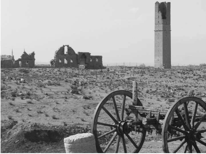
Harran Sin tapınağı. Eski tapınak üstüne yenisinin kurulması geleneği nedeniyle büyük ihtimalle Ulu Camii kalıntılarının altında olduğu tahmin ediliyor.

Hıristiyanlığın yayılmasıyla birlikte bazı Sabiiilerin bu dine geçtiğini, İslam idaresinde de Sabii felsefesinin devam ettiğini ancak Bağdat ve başka yerlerdeki bazı Sabii tabiplerin ve bilgin çevirmenlerin Müslüman olmadıklarını da belirtmiş.