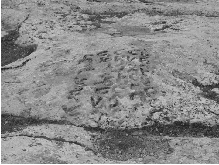
Soğmatar, Kutsal Tepe üstündeki kayalık kısımda eski Süryanice yazılar

kesme taşlardan silindirik formda inşa edilmiş bir Satürn tapınağı ve diğer tepelerde de Jüpiter, Ay, Venüs, Merkür, Mars tapınakları var. Bu tapınakların aynı zamanda tapınak rahiplerinin mezar yeri olarak da kullanıldığı tahmin edilmekte. Bazı araştırmacılar tarafından mezar yeri olarak yapıldıklarına inanılıyorsa da birbirinden oldukça uzak tepelerde inşa edilmiş, hepsinin köy merkezindeki kutsal tepeye bakıyor olması ve daha önemlisi, formlarının da gezegen tanrılara uygun biçimde inşa edilmiş olması,* mezar olarak düşünülmelerinden çok, tapınak olarak yapıldıkları kanısını uyandırmakta. Ancak, içlerinde herhangi bir Tanrı heykeli ya da kabartması