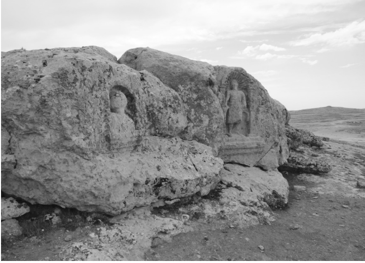
Soğmatar, Kutsal Tepe'deki kabartmalar

“Hz. Musa'nın Kuyusu” olarak adlandırılan ziyaretgâh nedeniyle Musa'nın burada çiftçilik yaptığına inanılır. Mardin yolu üzerinden Urfa'ya 33 kilometre mesafede Yardımcı nahiyesinin bir köyü durumunda. Köyün eteğindeki tepe üzerinde eski Süryanice yazılmış kaya kitabeleri ve iki kabartma var. Kabartmalardan biri başının üzerinde hilal olan erkek büstü. Solundaki kitabede, “ Sila bu simgeyi Adona'nın oğlu Tridates'in yaşamı ve kardeşlerinin yaşamı için yaşam tanrısı Sin'e adadı ” yazılı. Sağ tarafındaki kitabedeys; “ BAR KWZ.ZKY ve oğulları tanrı indinde anımsansın ” yazıyor. Bu kabartmanın sağında 110 santim yüksekliğinde diğer bir kabartmada, başında güneş kursu olan bir erkek figürü var. Bu figürün sağ yanında eski Süryanice, “ Bu imge 476 yılının Adar [Mişai Sitwa-ikinci ay-Mart ay] ayının 13. günü Ma'na'lı ilah tarafından buyuruldu ” yazıyor.