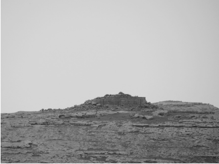
Soğmatar şehri merkezinde Kutsal Tepe. Diğer tepelerdeki tapınakların hepsi kutsal tepeye bakar.

bulunmamakta. Harran'da ay tapınağını ziyaret eden Sabiiler daha sonra Soğmatar'a gelip ibadetlerini tamamlarlar.