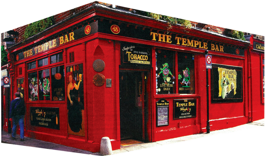
İrlanda’da bir bar.

İrlanda’da bir bara oturup barmene ya da yanı başınızda oturan al yanklı birine viskinin ilk defa nerede yapılmış olduğunu sorarsanız alacağınız yanıt, “İlk kez İrlanda’da 5. yüzyılda, St. Patrick’in imbiğinden damla-