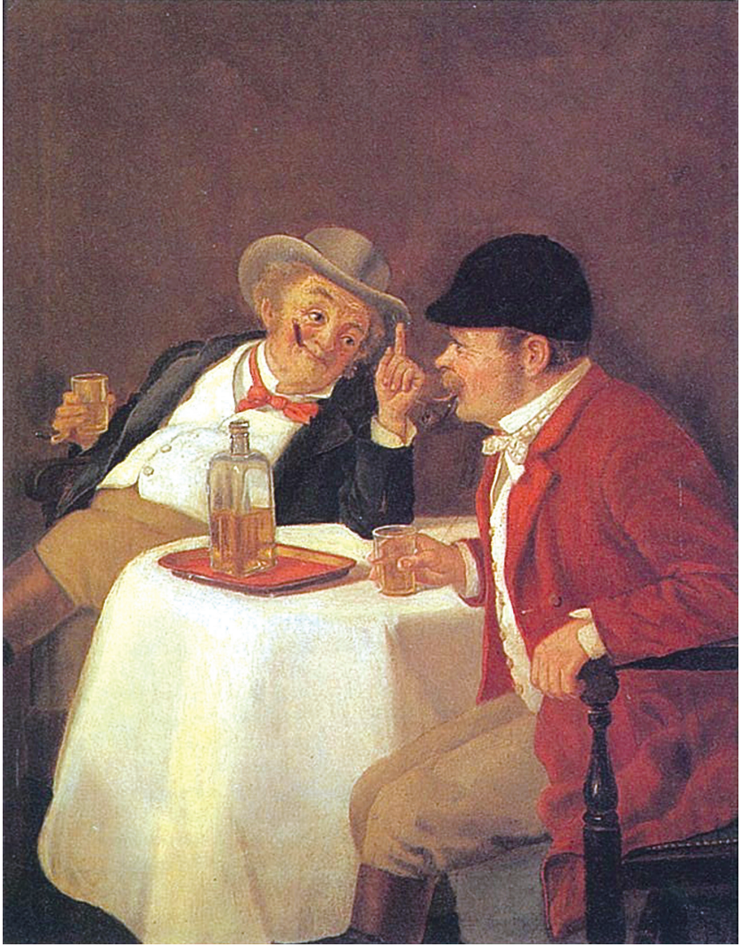
“Viski içen iki arkadaş”, George Broughton.